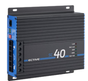
SC 40 bei 24-V-Batterien