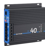
SC 40 bei 24-V-Batterien